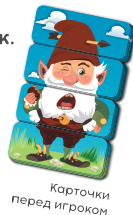
Карточки перед игроком

1 Каждый игрок берёт набор игрока (16 карточек с рубашкой одного цвета). (Скорее хватайтесь за любимый цвет и отбивайтесь от посягателей!) Внимательно изучите все 16 карточек.