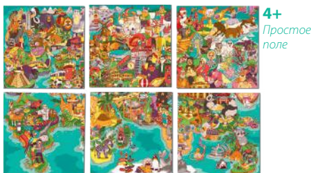
Рис. 1. Игровые поля

Даже если игрокам 8+ лет, начинать играть и разбираться с правилами лучше с простого поля, а после переходить на сложное. Поля состояются из 6 больших фрагментов. Каждый фрагмент пронумерован в уголке, чтобы удобнее было собрать поле.