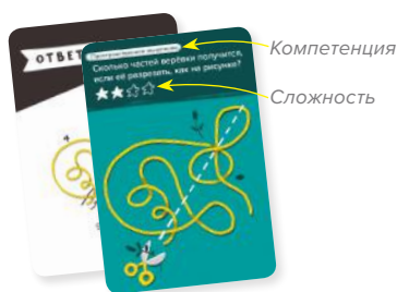
Рис. 1. Обозначения на картах.

Независимо от уровня подготовки игроков, рекомендуем начинать занятия с минимальной сложности: для старших детей они послужат хорошей разминкой и настроят на продуктивную работу.